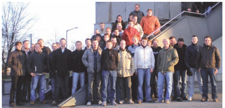
Die Klassen FTA06 und FTE06 in Nürnberg