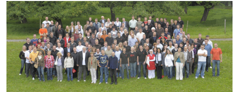
Avira Team 2009

Im November 2009 entsteht die neue Firmenzentrale im Kaplaneiweg, Tettngang.