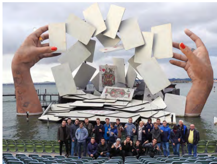
Die polnische Gruppe auf der Seebühne in Bregenz