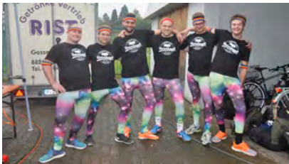
Sporttag im Regen