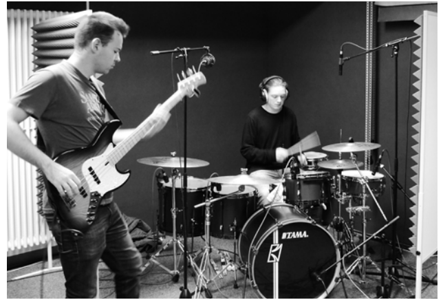
Tuesday's Edition bei der Probe

Der mittlere Raum wird auch für einfache Tonaufnahmen, wie das Besprechen von Filmen und natürlich für die Filmaufnahmen selbst genutzt. Dort befindet sich