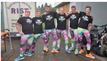
Sporttag im Regen