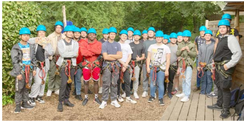
Schülergruppe vor dem Einstieg in den Kletterwald

Gemeinsam ging es dann auch hoch hinaus in den Kletterwald. Zwar musste jeder für sich die anstrengenden und wackligen Pas-