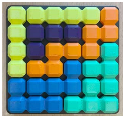
Tetris aus dem 3D-Drucker

So bekamen die Kinder durch den Kollegen Simon Blust einen Einblick in den 3D-Druck und waren erstaunt zu hören, dass damit auch Spielzeug gedruckt werden kann. Besonders begeisterte sie ein Tetris-Spiel aus dem 3D-Drucker, welches jedes Kind erhielt und mit nach Hause nehmen konnte. Sie erhielten auch die allseits bekannten und begehrten bunten Schlüsselanhänger der Elektronikschule.