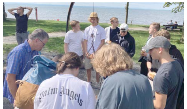
Abschlussgrillen am See