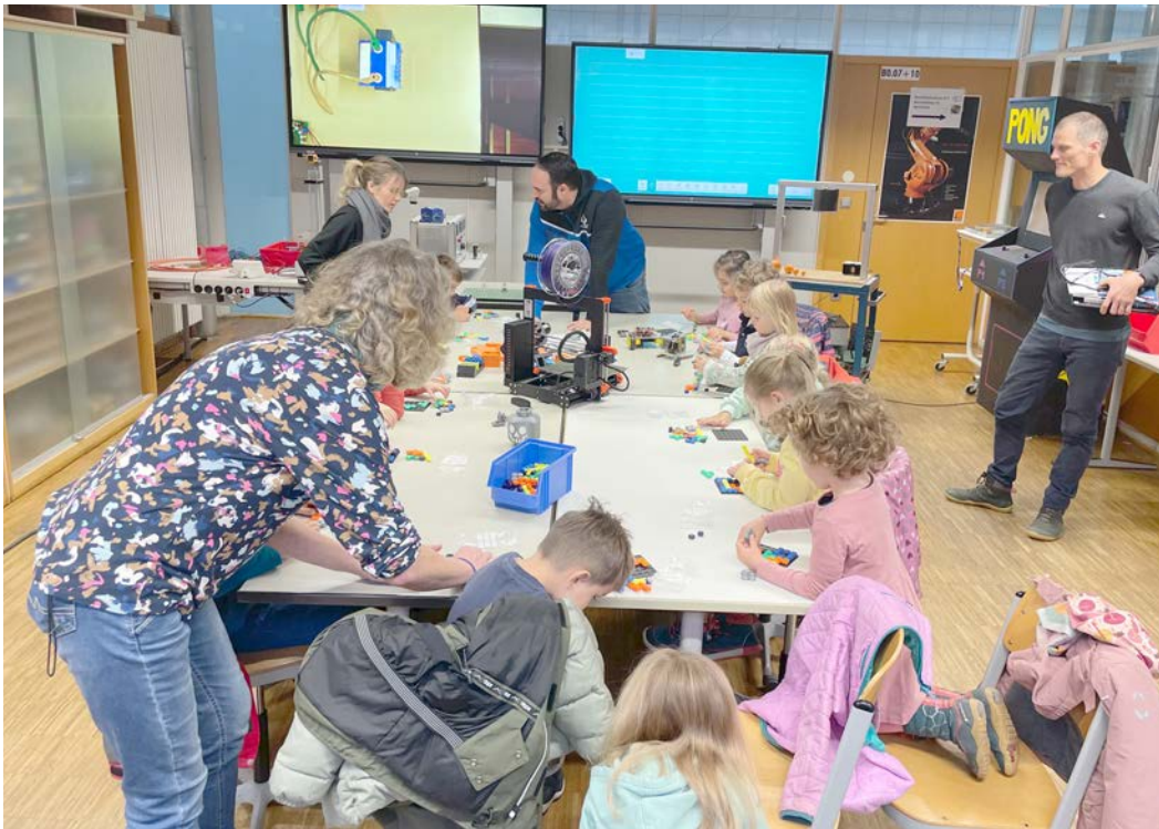
Die Kindergartenkinder lösen konzentriert die Tetris-Aufgabe