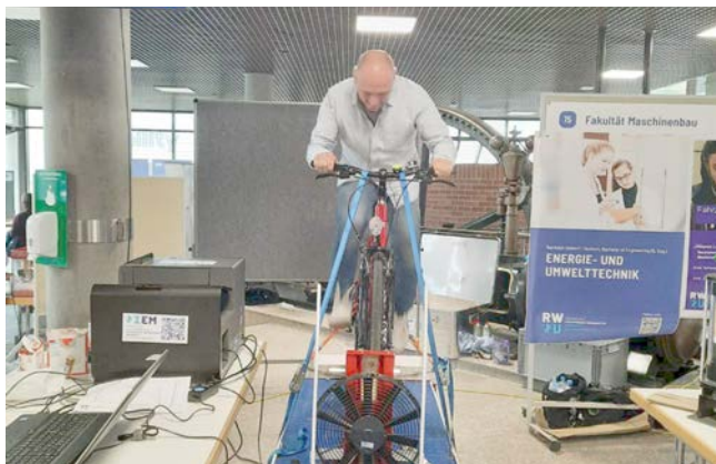
An der RWU wird die übriggebliebene Energie gemessen